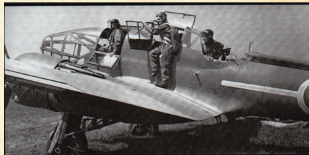
Le Potez 63-11 et son équipage