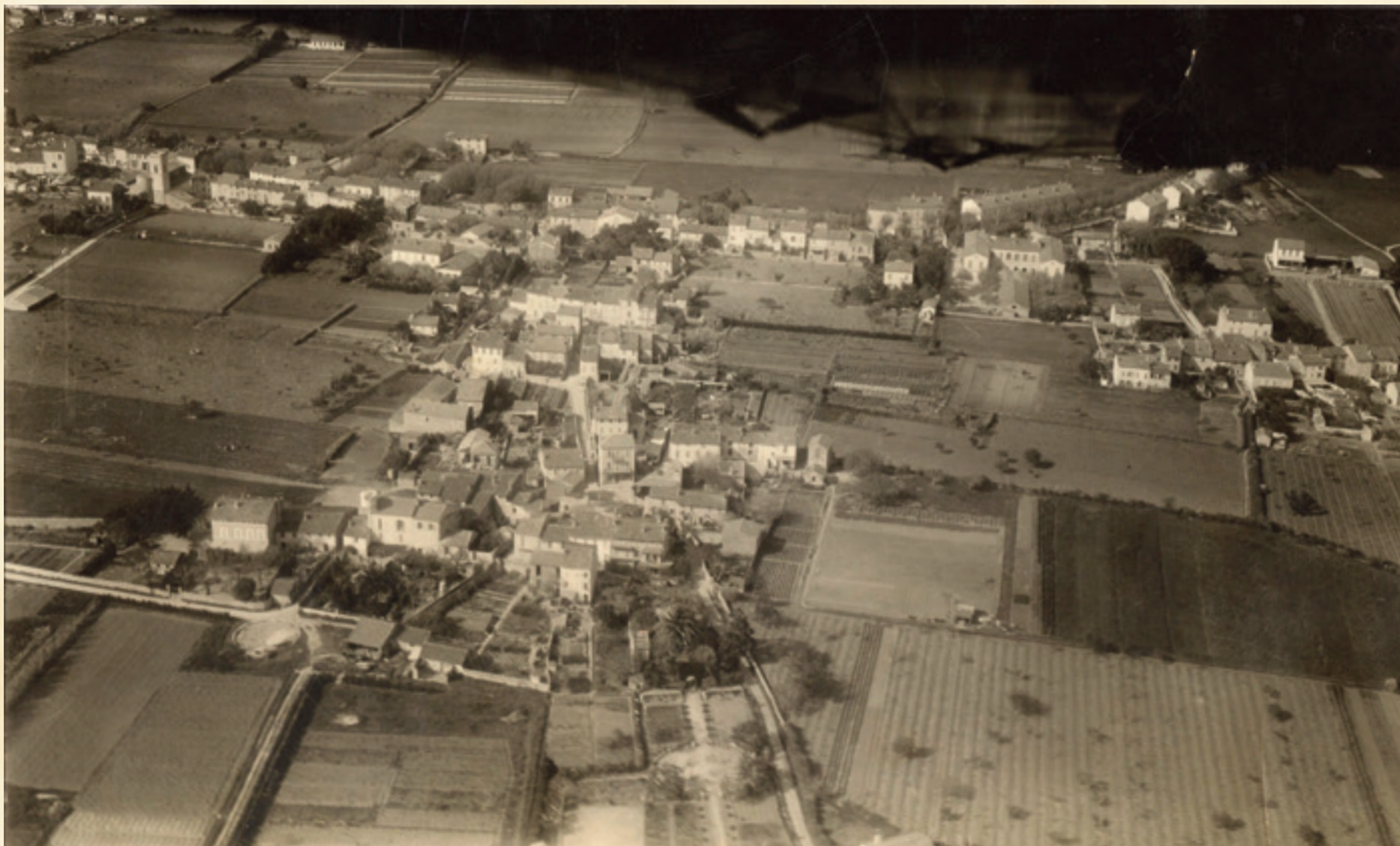
Une vue aérienne de Six-Fours (quartier Antelme) à la veille de la seconde guerre Mondiale.

Il entre à l'âge de 21 ans, le 29 septembre 1933, à l'Ecole Spéciale Militaire de Saint-Cyr dont il sort en tête de classement. En 1935 il entre à l'Ecole de l'Air et il est certifié officier-pilote en 1937. Il est intégré à l'escadrille de sa promotion, la promotion du Roi Albert 1er. Après un brillant début de carrière, il est promu lieutenant le 1er octobre 1937. Il prend le commandement de la 2 ème escadre du groupe I/35, le 23 février 1939