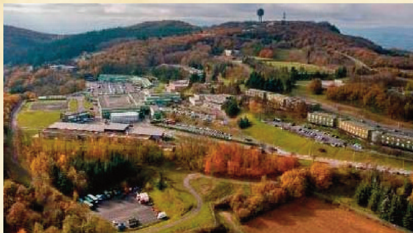
Vue aérienne de la base aérienne 942, Lyon-Mont-Verdun