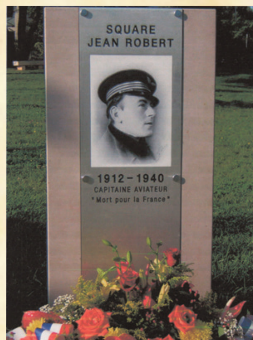
Inauguration du square Jean Robert, Rue Bouillibaye, à Six Fours